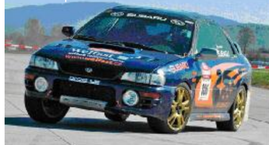
Subaru Impreza GT