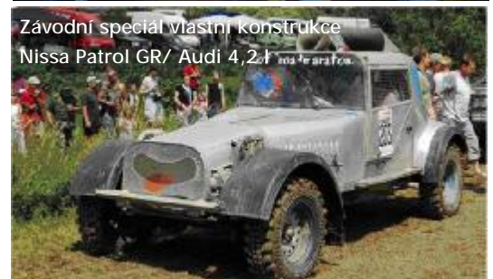
Závodní speciál vlastní konstrukce